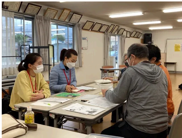
活動先の様子は、このような感じです。マンツーマンで対応いたしますよ(*^_^*)