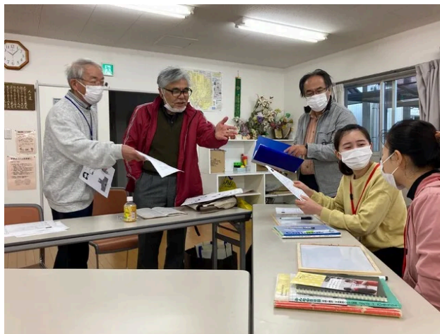
今日はどのような感じで学習を始めかにあたって、写真の右側に座っているお二人それぞれの日本語の理解を確かめていました。