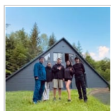
保健・医療・福祉 2日前