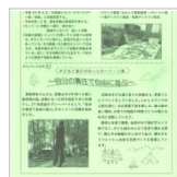
保健・医療・福祉 2日前