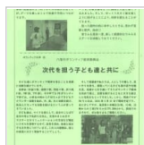
保健・医療・福祉 2日前