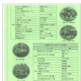
保健・医療・福祉 2日前