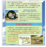
志紀小学校校区で開 1週間前