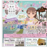
玉串川に船を浮か 3時間前