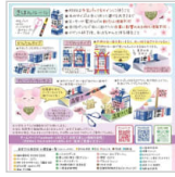
玉串川に船を浮か 3時間前