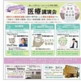
玉串川に船を浮か 3時間前