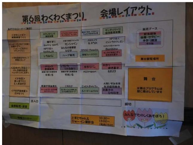
いろんな体験コーナーがあり、どのコーナーにも人だかりができていました。